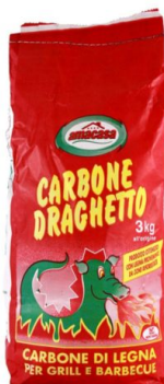
Draghetto Carbonella per Barbecue