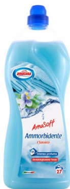
Amasoff Ammorbidente Classico 27 Lavaggi