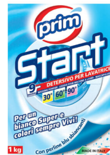
START Lavatrice Polvere 9 Lavaggi