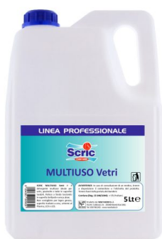
Scric Multiuso Vetri