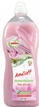
Amasoff Ammorbidente Fiori di Loto 27 Lavaggi