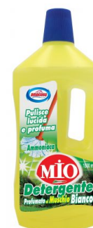
Detergente MIO Profumo Muschio Bianco