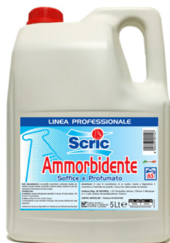
Scric Ammorbidente Classico 65 Lavaggi