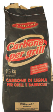
Carbonella per Barbecue kg 2,5