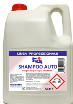
Scric Shampoo Auto