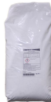
Sacco Lavatrice Polvere Standard