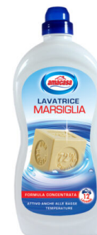
Lavatrice Marsiglia 12 Lavaggi