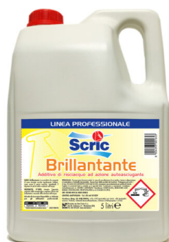
Scric Brillantante per Lavastoviglie