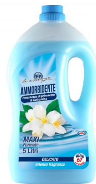
Ammorbidente Primavera e Gelsomino 67 Lavaggi