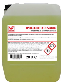
Cloro Puro 15/18%