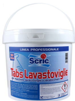
TAB 5in1 Lavastoviglie Fustino