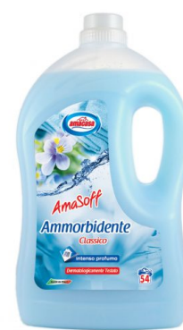
Amasoff Ammorbidente Classico 54 Lavaggi