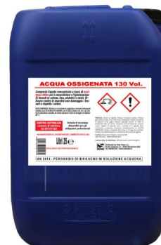
Acqua Ossigenata 130 Volumi