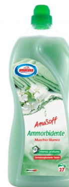
Amasoff Ammorbidente Muschio Bianco 27 Lavaggi