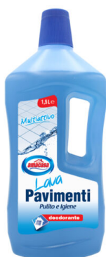
Lava Pavimenti Multiattivo