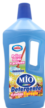
Detergente MIO Profumo Floreale