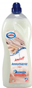
Amasoff Ammorbidente Talco 25 Lavaggi