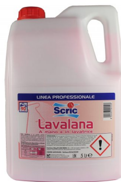
Scric Lavalana 90 Lavaggi