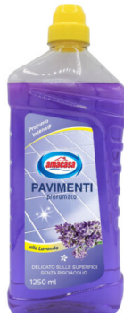
Pavimenti Lavanda 1250 ml