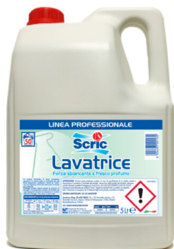
Scric Lavatrice 50 Lavaggi