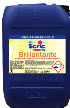
Brillantante per lavastoviglie