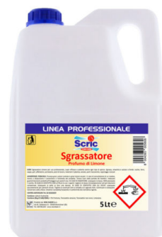
Scric Sgrassatore Limone