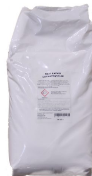
Sacco Lavastoviglie Polvere