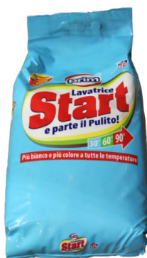
START Lavatrice 72 misurini